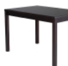
Table 4 pieds Basic